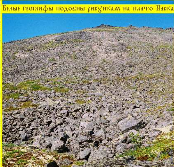
Белые геолифы подобны рисункам на плато Наска

Совокупность этих символов существует практически во всех культурах. Используются самые известные названия этих символов.